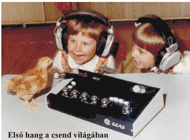
Első hang a csend világában

Az FDS 26-200 típusú sztereó fejhallgatónak egy különleges felhasználási területe is van. Kiváló akusztikai tulajdonságai miatt nagyothallók oktatására is alkalmas.